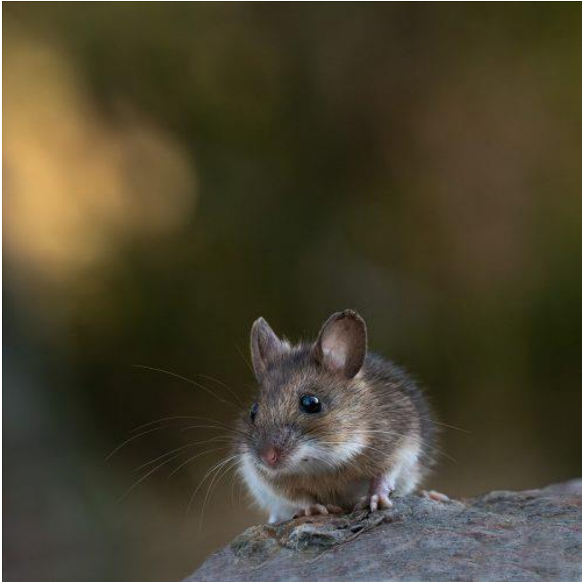
Vinnarbilden i fototävlingen 2024